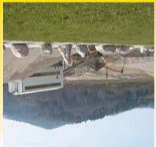
Kies - Transporte - Erdbau - Deponie